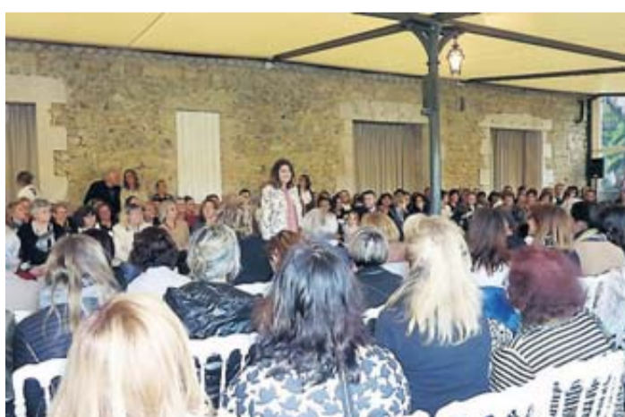
Les mannequins bénévoles ont été ovationnés.

La deuxième édition du défilé de mode, organisé ce dernier vendredi dans le magnifique cadre viticole du château La Hitte, a connu un vif succès avec une fréquentation en nette augmentation. Deux heures durant, les mannequins tous bénévoles ont présenté certains pour la première fois, la collection printemps-été des vêtements, chaussures et accessoires de mode, en vente dans des magasins et boutiques de l'Albret et l'Agenais. Le nombreux public a chaleureusement applaudi les « stars d'un soir » dont certaines très jeunes, souriantes bien que plus ou moins impressionnées, mais qui, sans nul doute, ont su transmettre